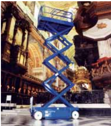
Kompakte Abmessungen und ein enger Wendekreis bieten exzellente Manövrierfähigkeit.

Spezifikationen können ohne vorherige Ankündigung geändert werden. Die hier abgebildeten Fotos und Diagramme dienen nur der Werbung. Beziehen Sie sich auf UpRight Bedienerhandbücher für die richtige Anwendung und Wartung dieser Ausrüstung.